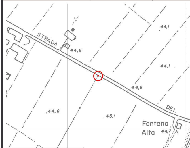
CTR 1:5.000 (elemento 162164)