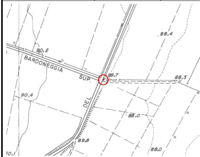
CTR 1:5.000 (elemento 161092)