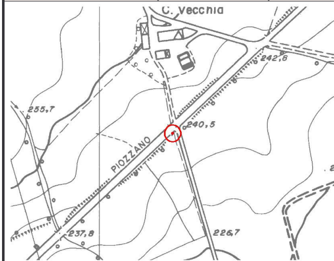
CTR 1:5.000 (elemento 179074)