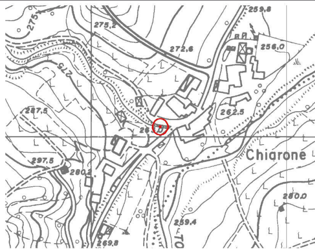
CTR 1:5.000 (elemento 179052)