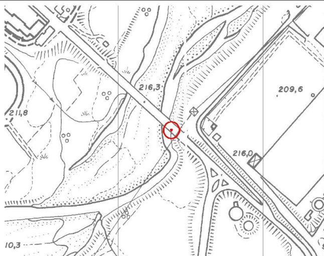
CTR 1:5.000 (elemento 180142)