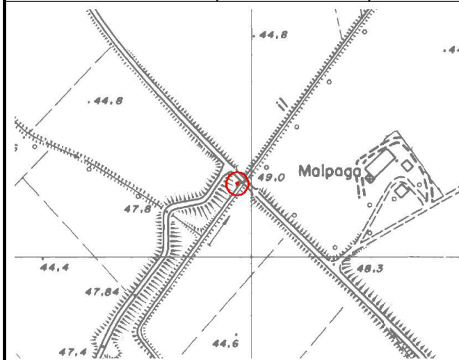
CTR 1:5.000 (elemento 162103)