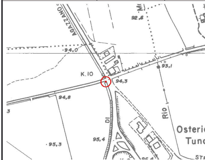
CTR 1:5.000 (elemento 179031)