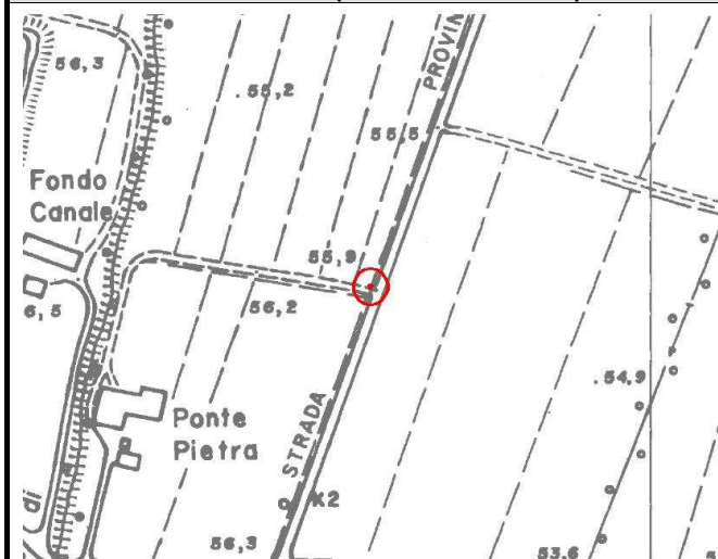
CTR 1:5.000 (elemento 180043)