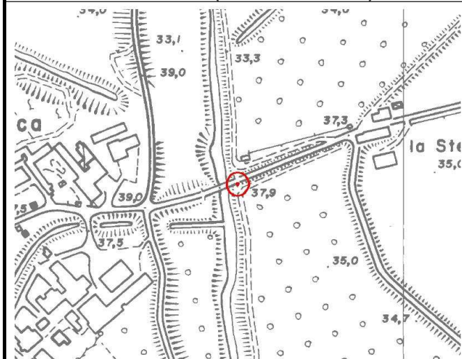
CTR 1:5.000 (elemento 163134)