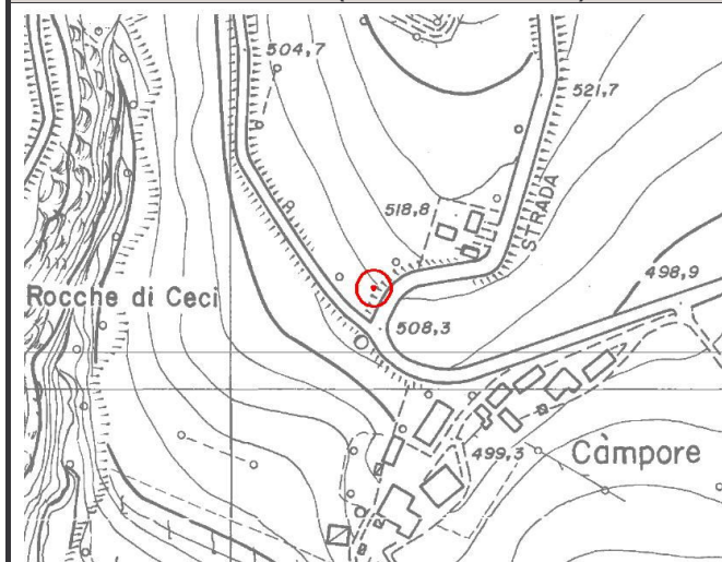
CTR 1:5.000 (elemento 197014)