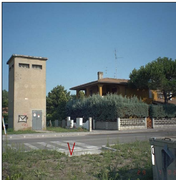
Vertice GPS N019 (file N019-foto.tif)