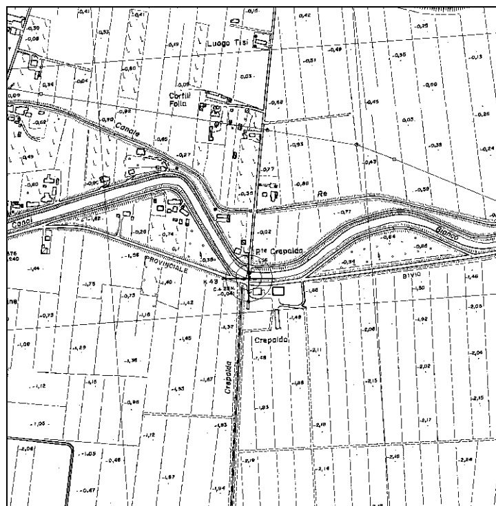
Cartografia Regionale, riduzione 1:10.000 (file N029-10.tif)