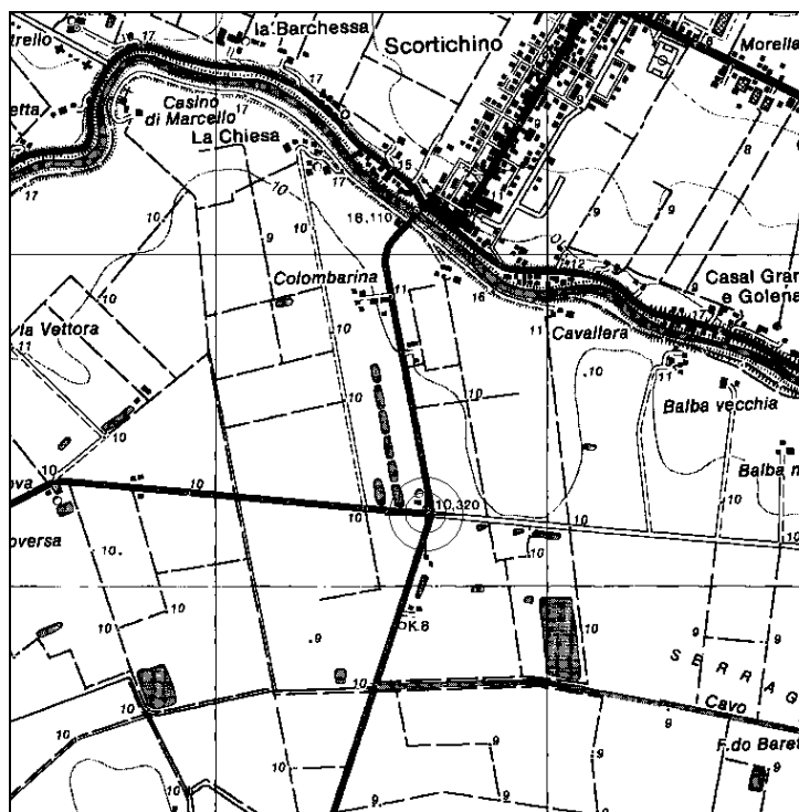
Cartografia IGM 1:25.000 (file N002-25.tif)