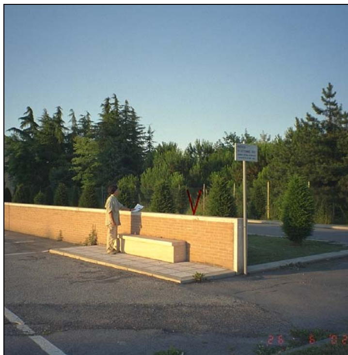
Vertice GPS N035 (file N035-foto.tif)