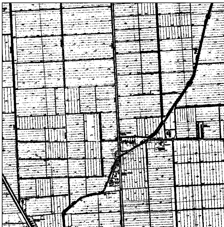
Cartografia IGM 1:25.000 (file N039-25.tif)