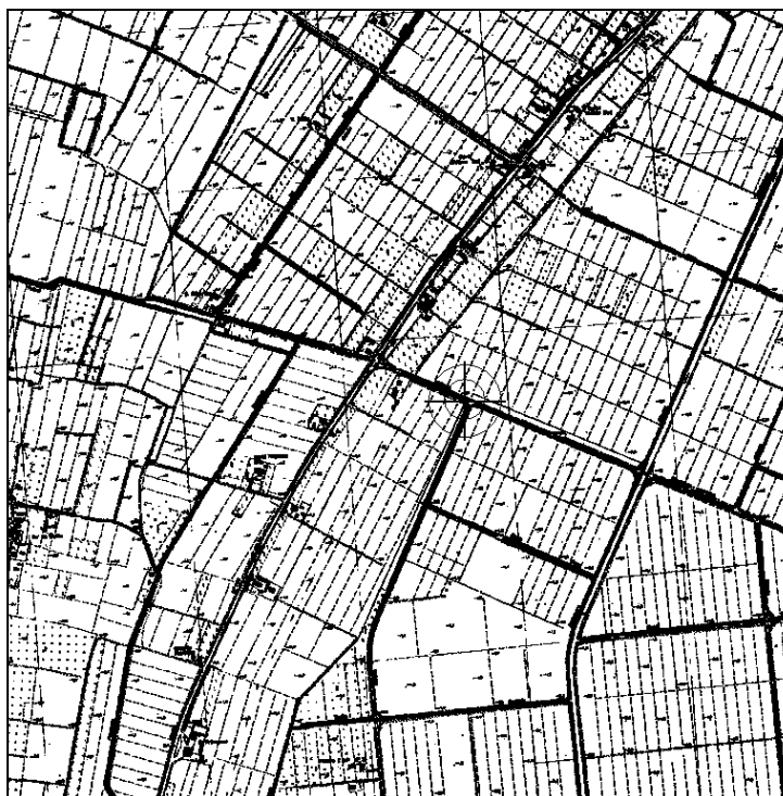
Cartografia IGM 1:25.000 (file N032-25.tif)