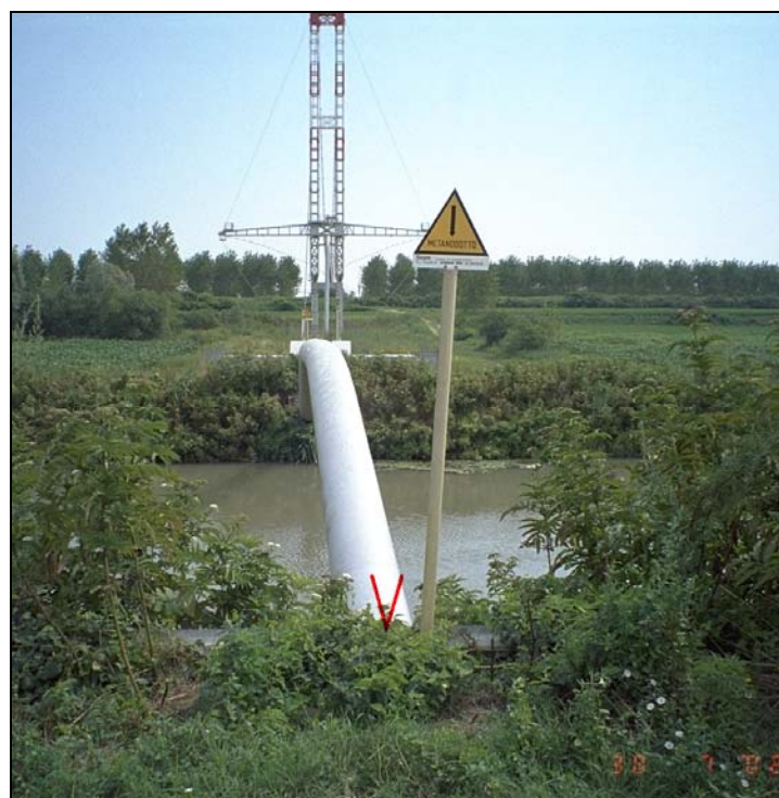
Vertice GPS N033 (file N033-foto.tif)