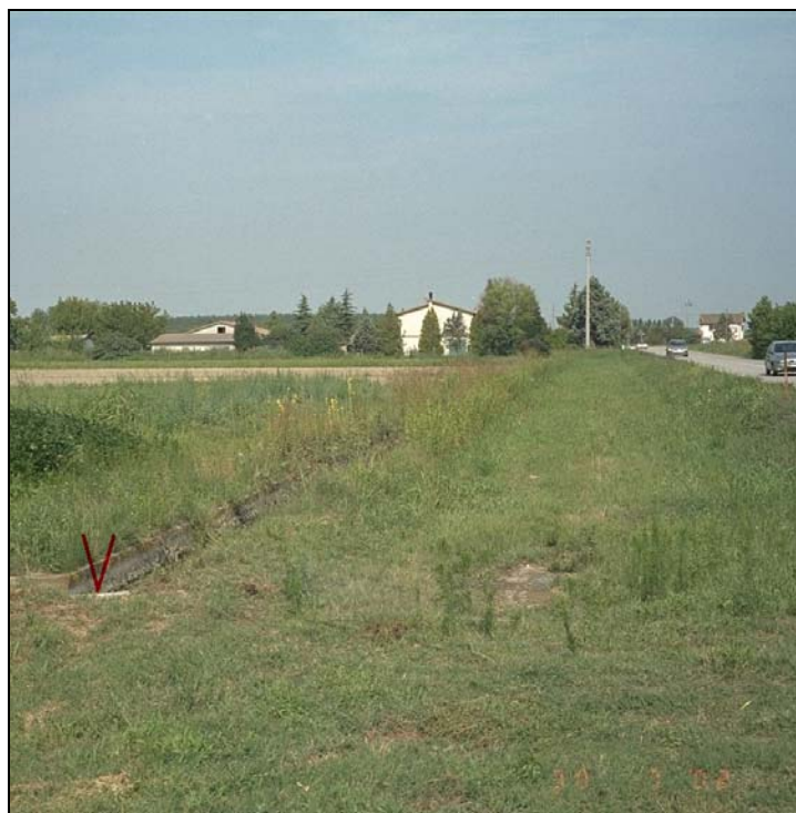
Vertice GPS N032 (file N032-foto.tif)