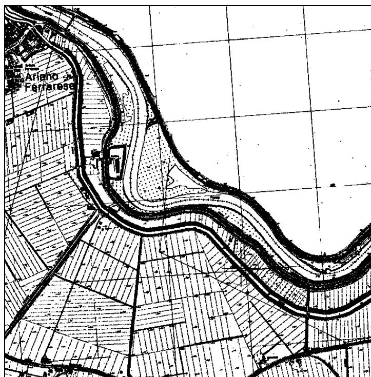
Cartografia IGM 1:25.000 (file N033-25.tif)