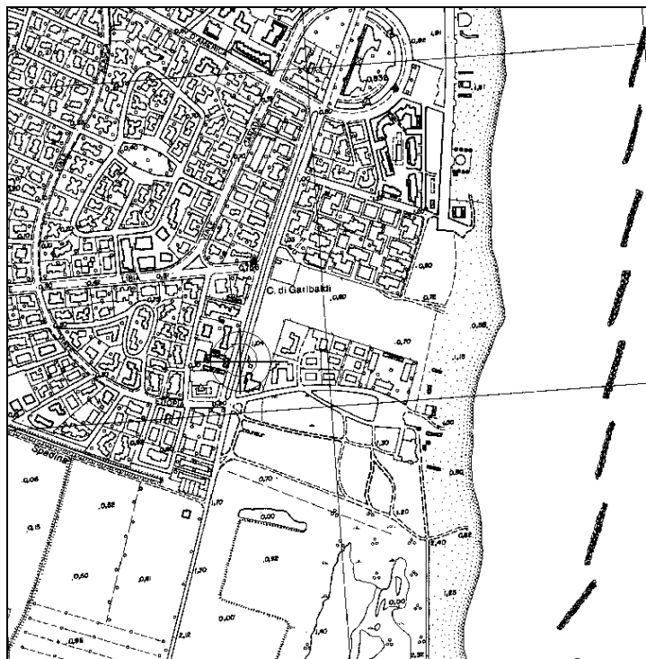
Cartografia Regionale, riduzione 1:10.000 (file N019-10.tif)