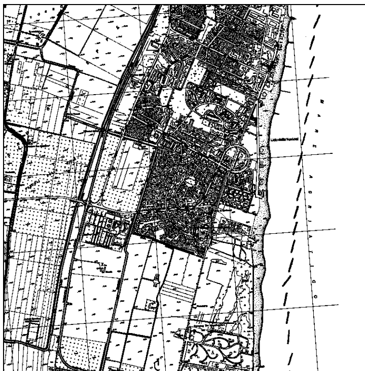
Cartografia IGM 1:25.000 (file N019-25.tif)