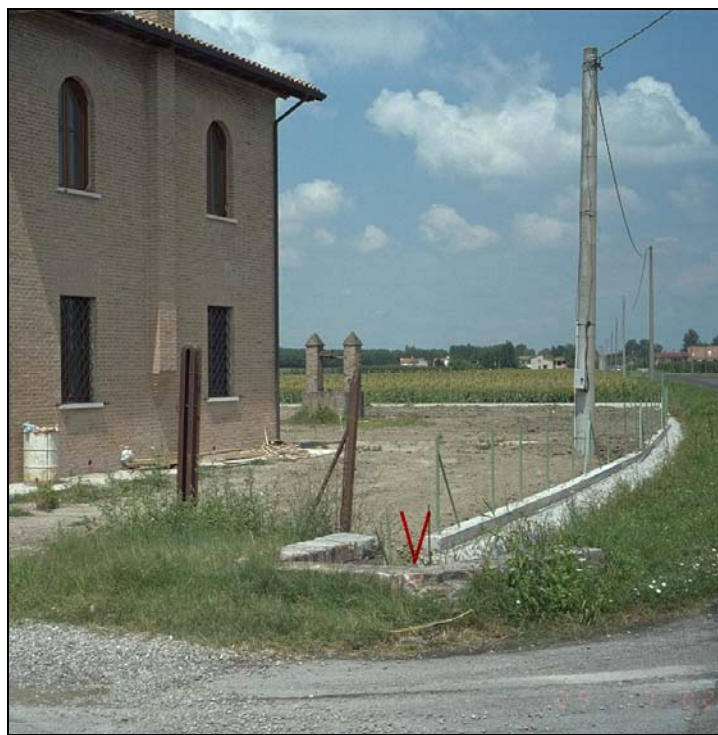
Vertice GPS N002 (file N002-foto.tif)