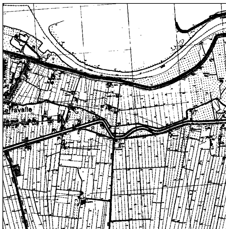
Cartografia IGM 1:25.000 (file N029-25.tif)