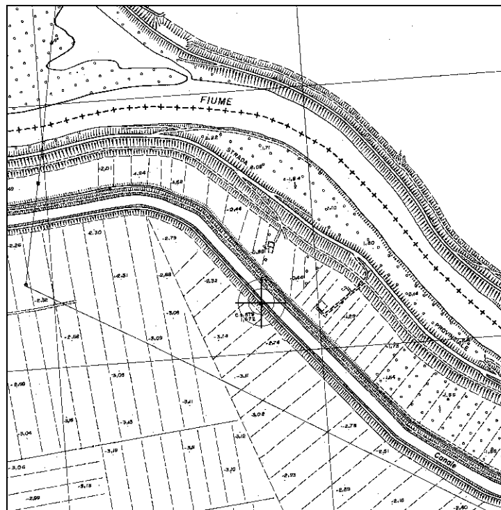
Cartografia Regionale, riduzione 1:10.000 (file N033-10.tif)