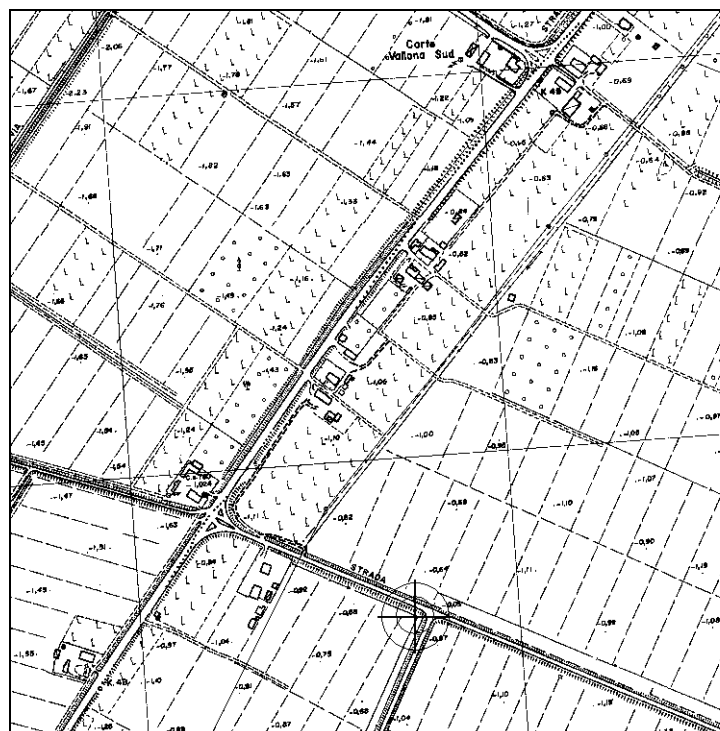
Cartografia Regionale, riduzione 1:10.000 (file N032-10.tif)