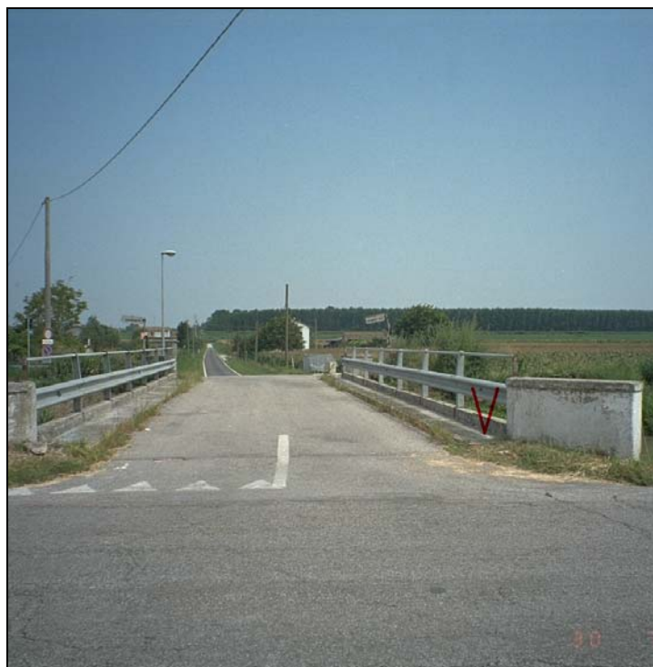
Vertice GPS N029 (file N029-foto.tif)