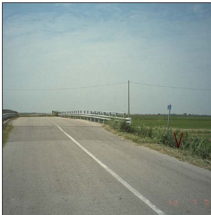
Vertice GPS N039 (file N039-foto.tif)