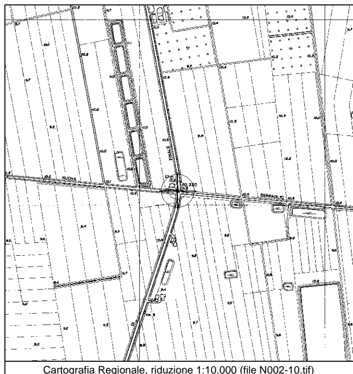
Cartografia Regionale, riduzione 1:10.000 (file N002-10.tif)