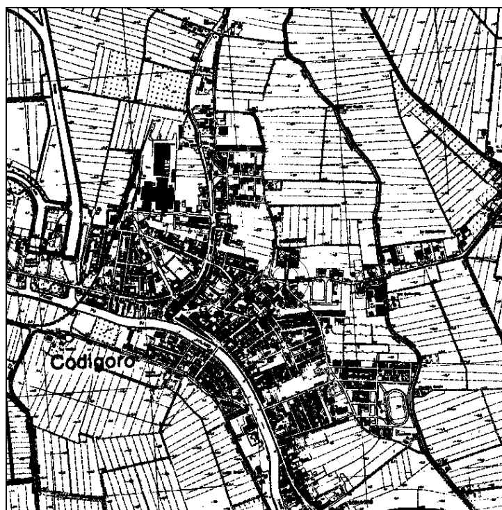
Cartografia IGM 1:25.000 (file N035-25.tif)