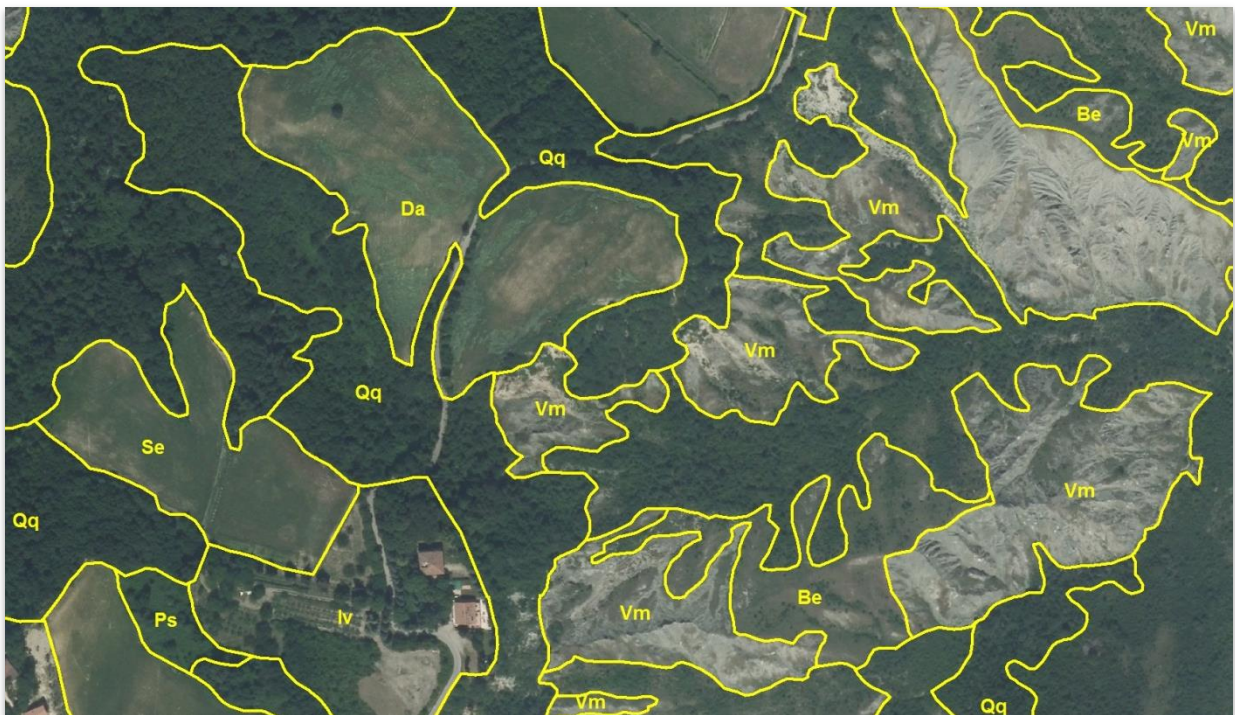
Figura 1 – Ortofoto AGEA 2011 con la copertura della vegetazione aggiornata.

Il grande dettaglio delle ortofoto ha permesso di ridisegnare con precisione i limiti dei poligoni riferiti alle varie tipologie di vegetazione e aggiornare le aree dove si erano registrati cambiamenti del tipo di vegetazione presente dovuti ad evoluzione della stessa nel tempo o ad interventi antropici.